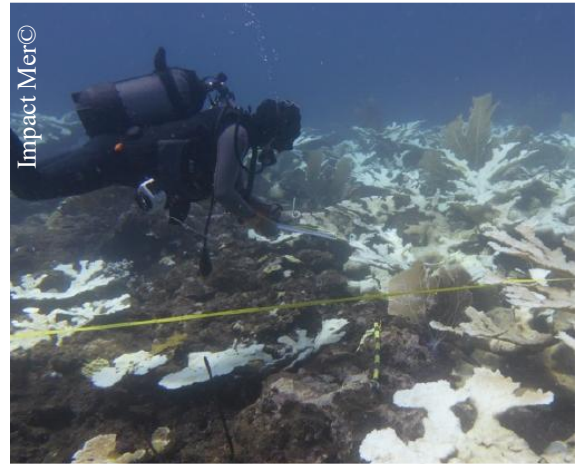
Fig. 4. Blanchissement massif des Acropora en 2023.

L'épisode de 2023 a impacté 84% des colonies et a causé une mortalité de 34% de la couverture corallienne (taux de mortalité reporté lors du suivi de février 2024). Les espèces Acropora palmata , Agaricia humilis , Porites porites ont été particulièrement affectées avec des mortalités de près de 90% de ces colonies (Impact Mer 2024 ; Fig.4).