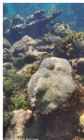
Fig. 7. Suivi des communautés récifales à Saint-Martin en septembre 2024.

Néanmoins, les suivis des 8 stations récifales du réseau AMP réalisés en septembre 2024 (AquaSearch – SeaLens – Stegastes Consulting 2024 ; Fig.7) et en février/mars 2025 (données de suivis AGRNSM 2025) indiquent une baisse du recouvrement corallien de près de 40% pour atteindre en 2025 une couverture moyenne de 5,8%. Cette diminution pourrait être liée à l'impact cumulé des épisodes de blanchissement corallien.