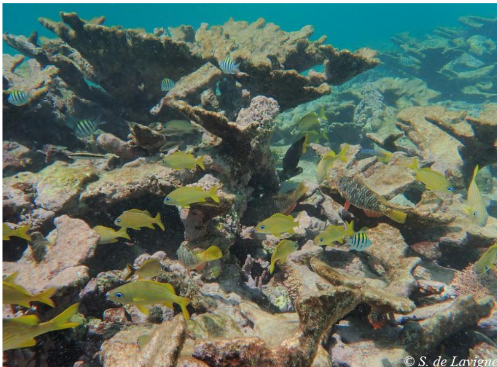
Fig. 3. Mortalité des champs d' Acropora palmata sur le platier de la barrière récifale du lagon du Grand Cul-de-Sac Marin (Guadeloupe).

Ces phénomènes de blanchissement conduisent à une modification de la structure des communautés coralliennes, avec la perte des espèces bioconstructrices (Acroporidae, Fig.3) et la prédominance d'espèces plus résistantes, telles que Porites astreoides , Madracis decactis , Siderastrea siderea , Siderastrea radians , Millepora spp. Il est à noter que ces espèces de plus petite taille, avec parfois des colonies morcelées ou encroûtantes, contribuent peu à la structuration tridimensionnelle des récifs. Ces changements de communautés auront un impact sur les fonctionnalités écologiques des récifs coralliens des Antilles.