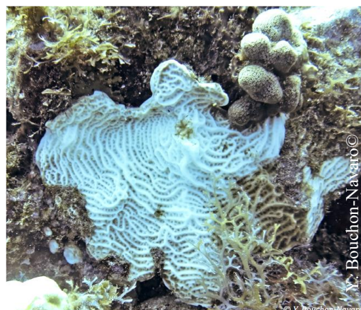
Fig. 6. Blanchissement des coraux constaté dans la station de St-Barthélemy fin 2024.

Cette diminution de 40% de la couverture corallienne pourrait être reliée aux effets de la maladie SCTLN et à l'impact des phénomènes de blanchissement.