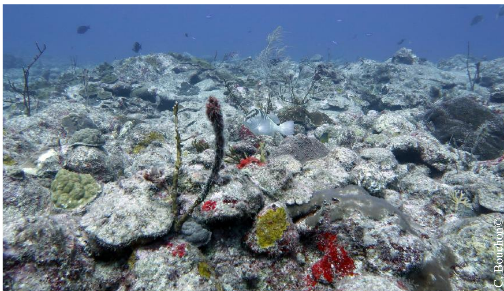
Fig. 5. Récif corallien en Guadeloupe en septembre 2025.

En Guadeloupe, plusieurs suivis dédiés au blanchissement corallien ont pu être mis en œuvre : - un suivi réalisé de 2023 à 2025 sur 20 stations par le groupement ÉcoRécif Environnement et Caraïbe Aqua Conseil pour le compte du Grand Port Maritime de la Guadeloupe (Bouchon et al. 2024, 2025) - un suivi réalisé de 2023 à 2024 sur 4 stations par le bureau d'études Créocéan pour l'ODE Guadeloupe (Créocéan 2024).